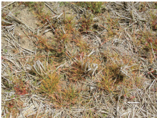
第4図 グリホサートカリウム塩液剤散布後約10日後の様子 (2023.4.21撮影)