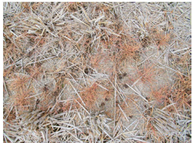
第5図 グリホサートカリウム塩液剤散布後約20日後の様子 (2023.5.1撮影) カズノコグサは枯死していた。