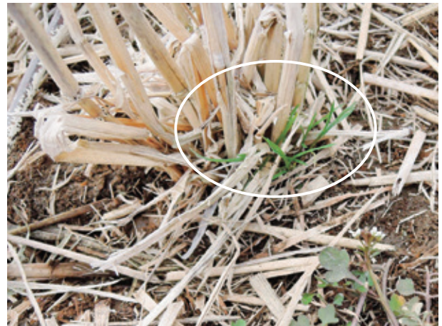
第3図 イネの株元から発生したカズノコグサ (2023.3.9撮影)