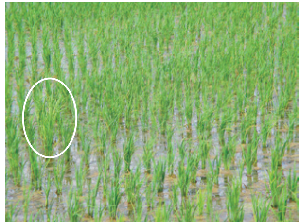
第1図 水稲ほ場内で出穂したカズノコグサ（2021.6.8撮影）

聞き取り調査は2022年から2024年の3年間で実施した。カズノコグサ発生ほ場は秋田県沿岸部の水田（150m×125m）であり、対象ほ場を管理している生産者および地域振興局農林部の採種ほ場担当者から管理方法等について聞き取りを実施した。