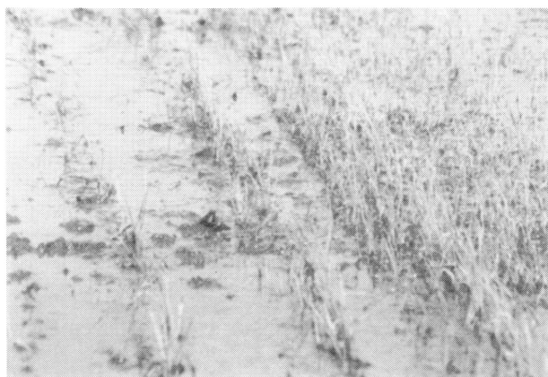
第1図 第1回目の機械除草時の残草 2006年6月3日調査

高精度水田除草機の除草効果については、福島県農業試験場の試験結果(2002)では、株間の除草効果がやや