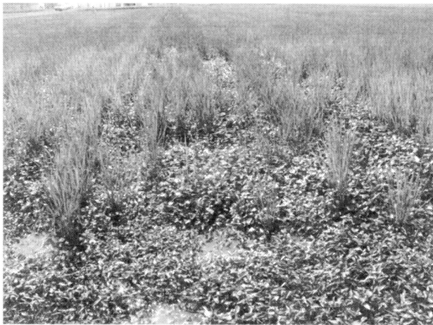
第3図 高精度水田除草機によるコナギの発生 会津坂下町（2006年7月）