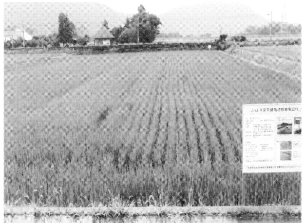
第6図 紙マルチ栽培の生育状況 会津若松市（2006年7月18日）