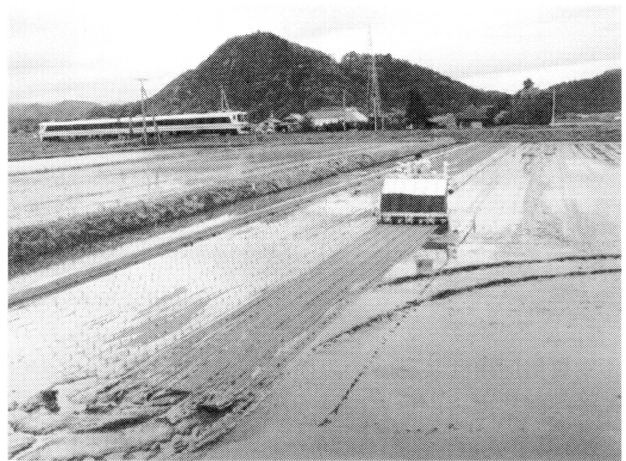
第5図 紙マルチの敷設作業 会津若松市（2006年5月）