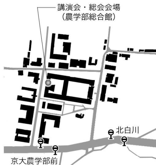
第3図 北部キャンパス